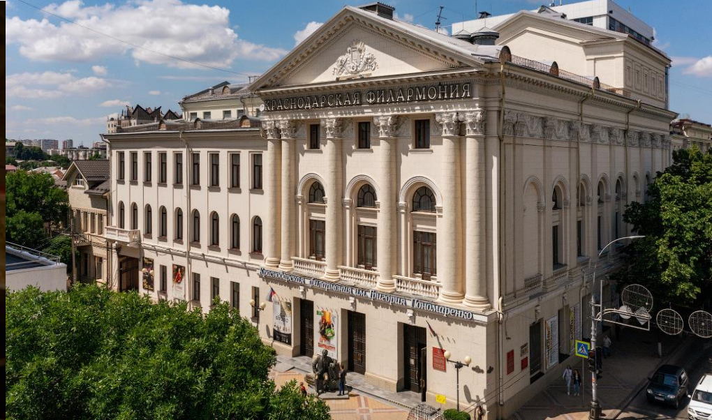
Краснодарская филармония имени Григория Пономаренко