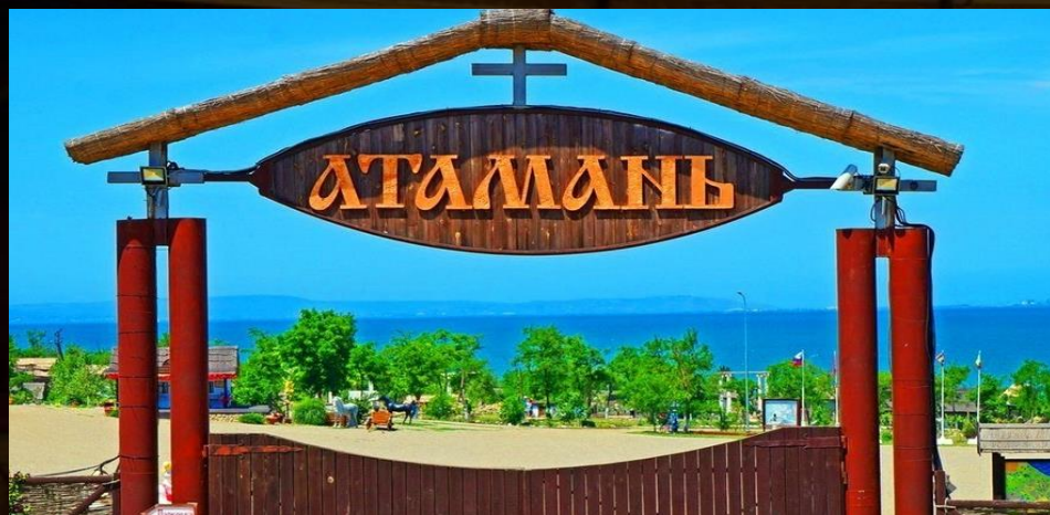
Атамань — комплекс казачьей столицы